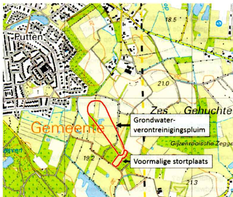
Afbeelding 1: ligging voormalige stortplaats en grondwaterverontreinigingspluim

In de periode 1951-1971 is Gijzenrooi in gebruik geweest als stortplaats, waar afval gestort is door nabij gelegen industrie. Als gevolg hiervan is in de loop der jaren het grondwater verontreinigd geraakt. Op onderstaande figuur zijn de ligging van de voormalige stortplaats en de grondwaterverontreinigingspluim weergegeven.